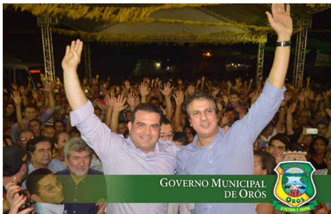
GOVERNO MUNICIPAL DE ORÓS

O governador do Ceará, Camilo Santana, e, o prefeito de Orós, Simão Pedro, inauguraram em dezembro a pavimentação asfáltica Rochedo/Malhada Vermelha, na zona rural, com uma extensão de 24 Km.