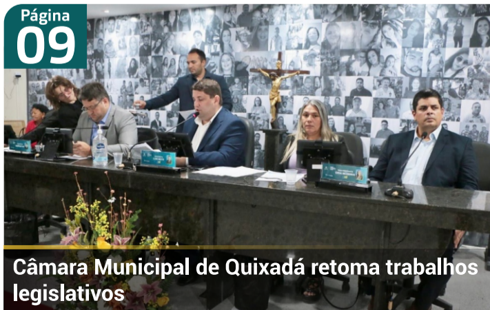
Câmara Municipal de Quixadá retoma trabalhos legislativos