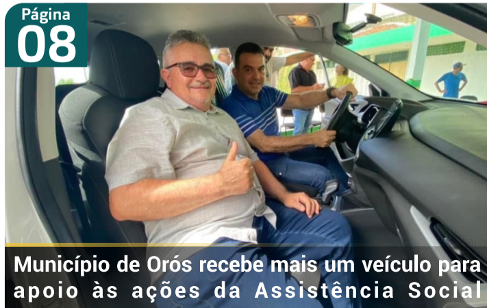
Município de Orós recebe mais um veículo para apoio às ações da Assistência Social