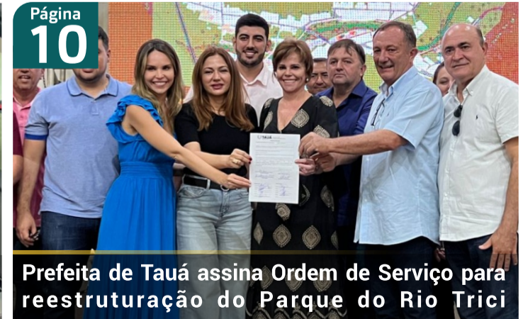
Prefeita de Tauá assina Ordem de Serviço para reestruturação do Parque do Rio Trici