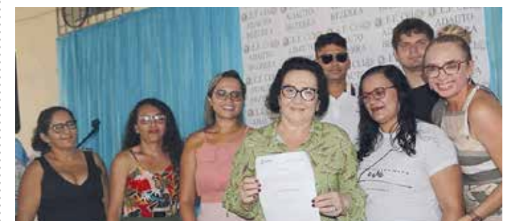
CANINDÉ PÁGINA 16

Prefeita prestigia confraternização dos Garis e entrega novos fardamentos