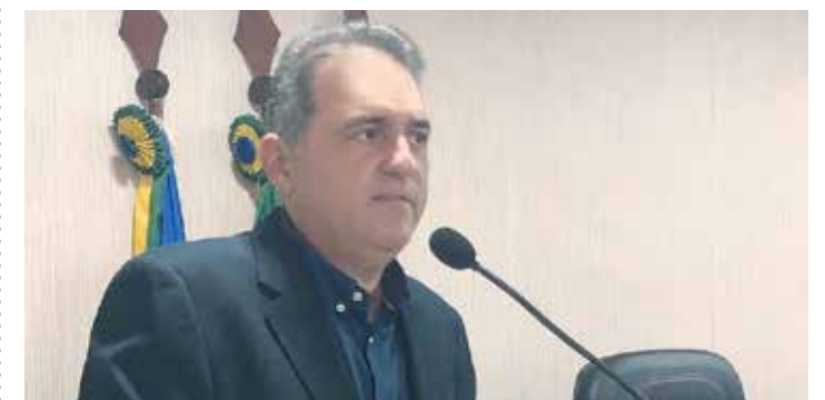
MOMBAÇA PÁGINA 13

Secretaria de Saúde realiza curso de Emergências Clínicas