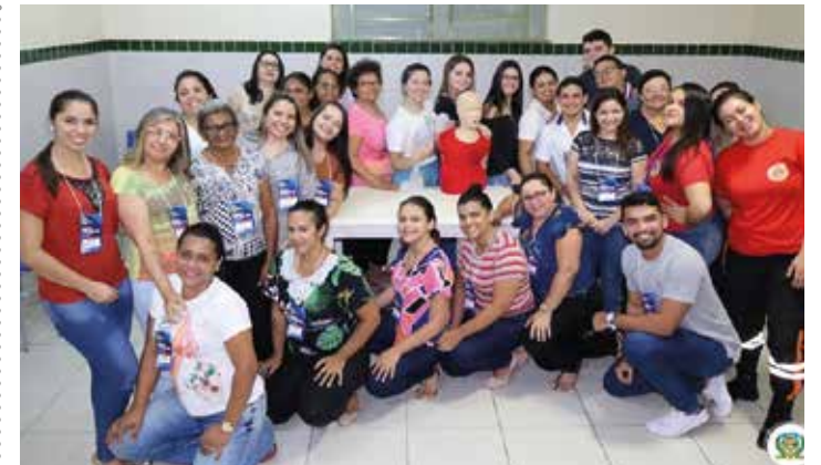
QUIXERAMOBIM PÁGINA 09

R$ 11.500.000,00 devem ser investidos em asfalto, recuperação de estradas e quadras esportivas em Parambu