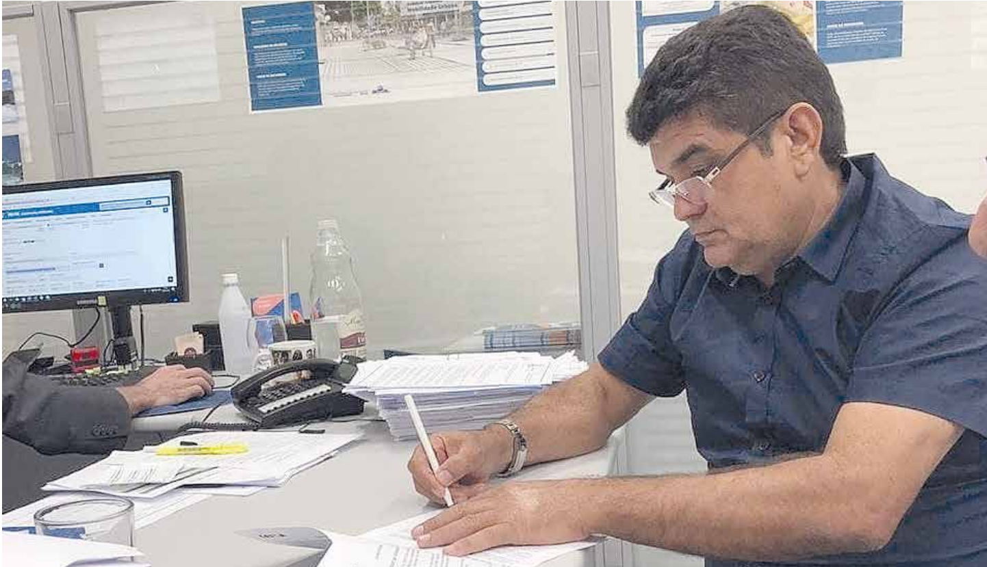
PARAMBU PÁGINA 05

R$ 11.500.000,00 devem ser investidos em asfalto, recuperação de estradas e quadras esportivas em Parambu