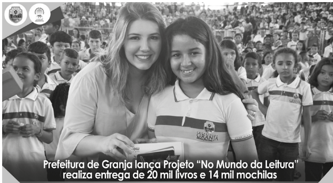
Prefeitura de Granja lança Projeto “No Mundo da Leitura” realiza entrega de 20 mil livros e 14 mil mochilas

A Prefeitura de Granja, através da Secretaria Municipal de Educação, em parceria com a Editora EGEIROS, lançou