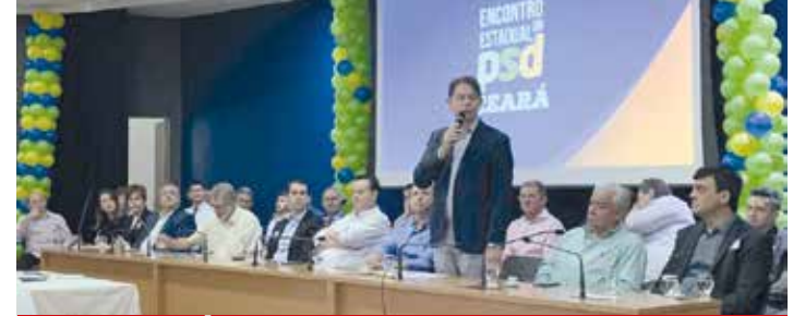
CEARÁ PÁGINA 04