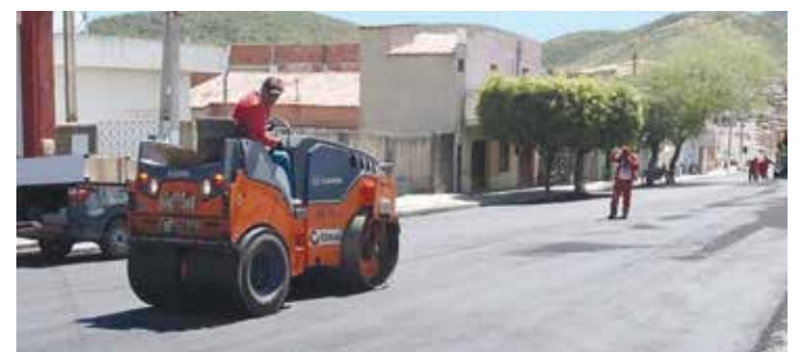
ORÓS PÁGINA 12