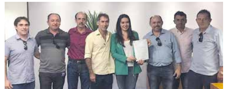
INDEPENDÊNCIA PÁGINA 07