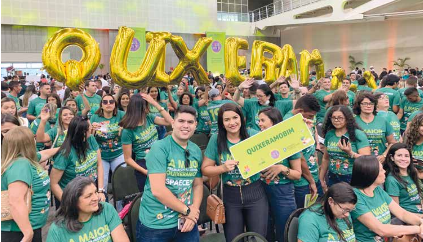
QUEXERAMOBIM PÁGINA 09