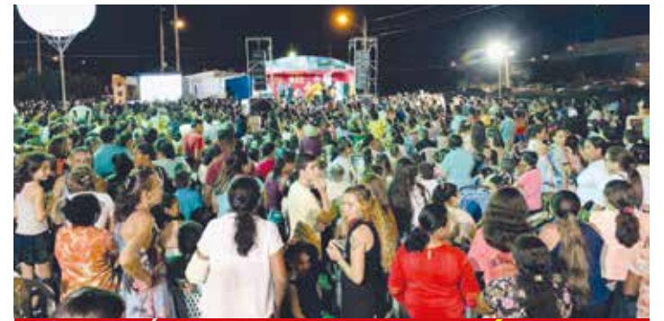
TAUÁ PÁGINA 06