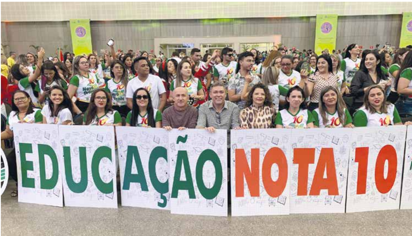
NOVO ORIENTE PÁGINA 10