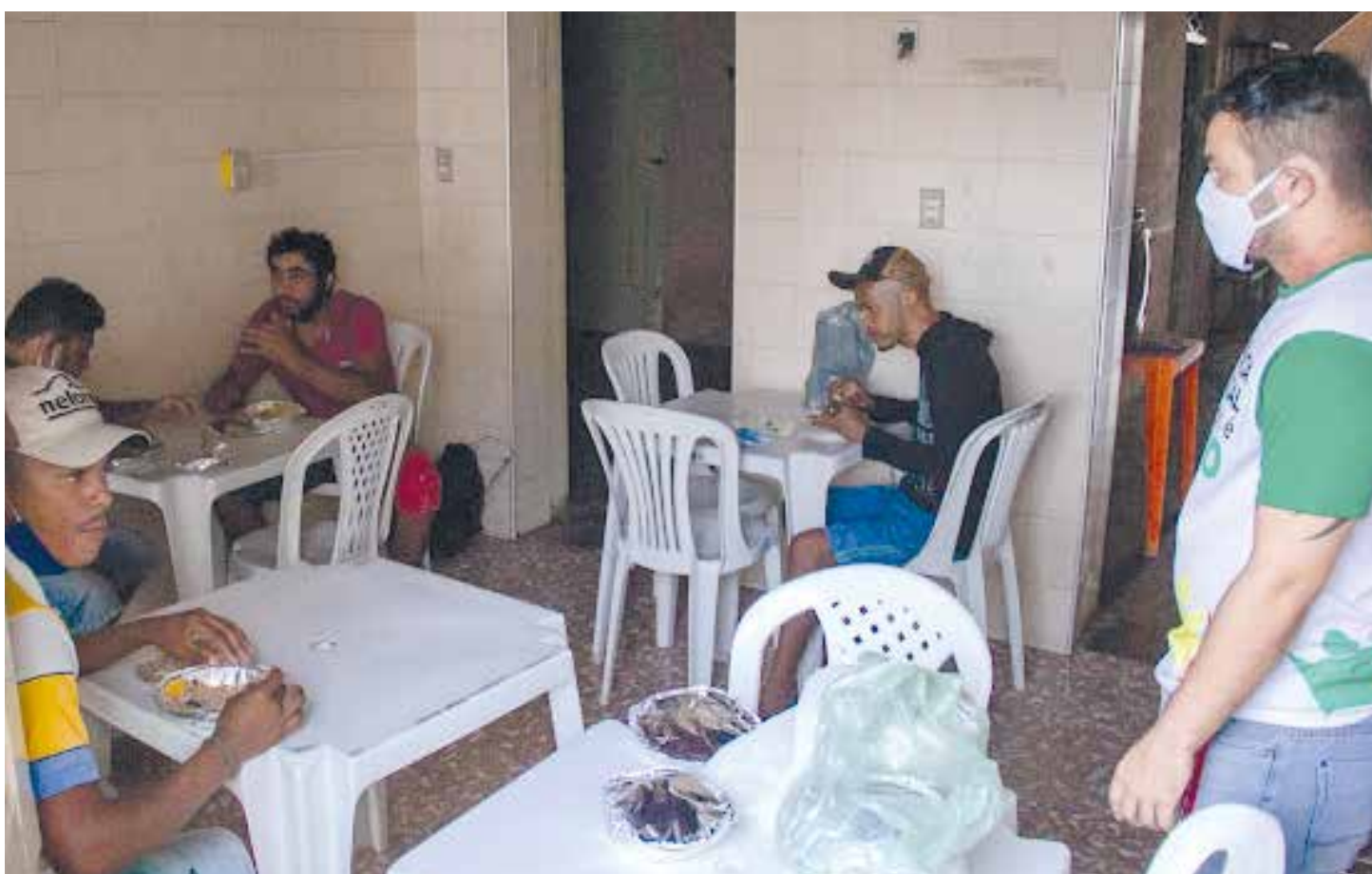
➔ TAUÁ PÁGINA 04