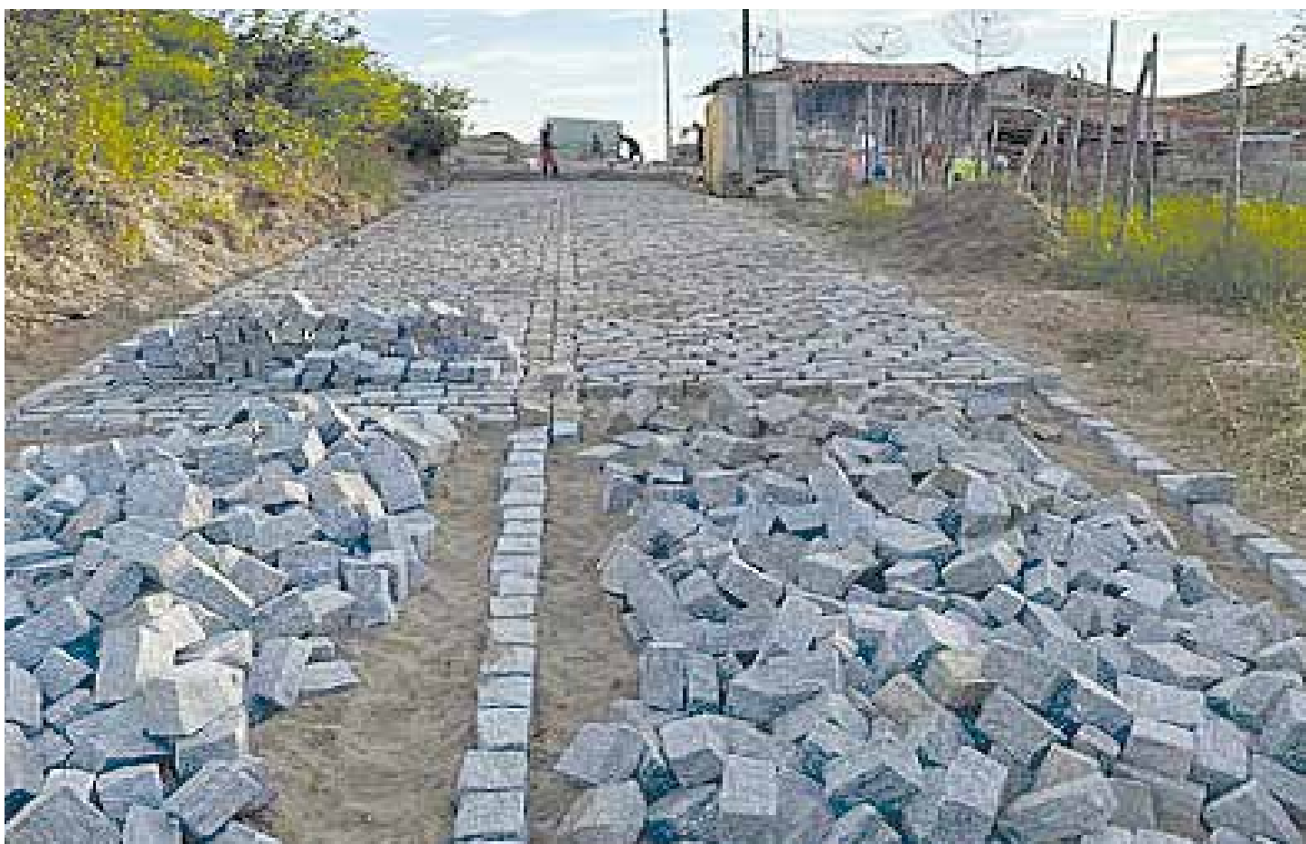
➔ MOMBAÇA PÁGINA 03