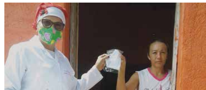
➔ ICÓ PÁGINA 08