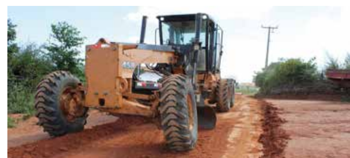
➔ PARAMBU PÁGINA 06