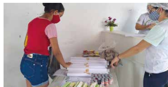
➔ PARAMOTI PÁGINA 05