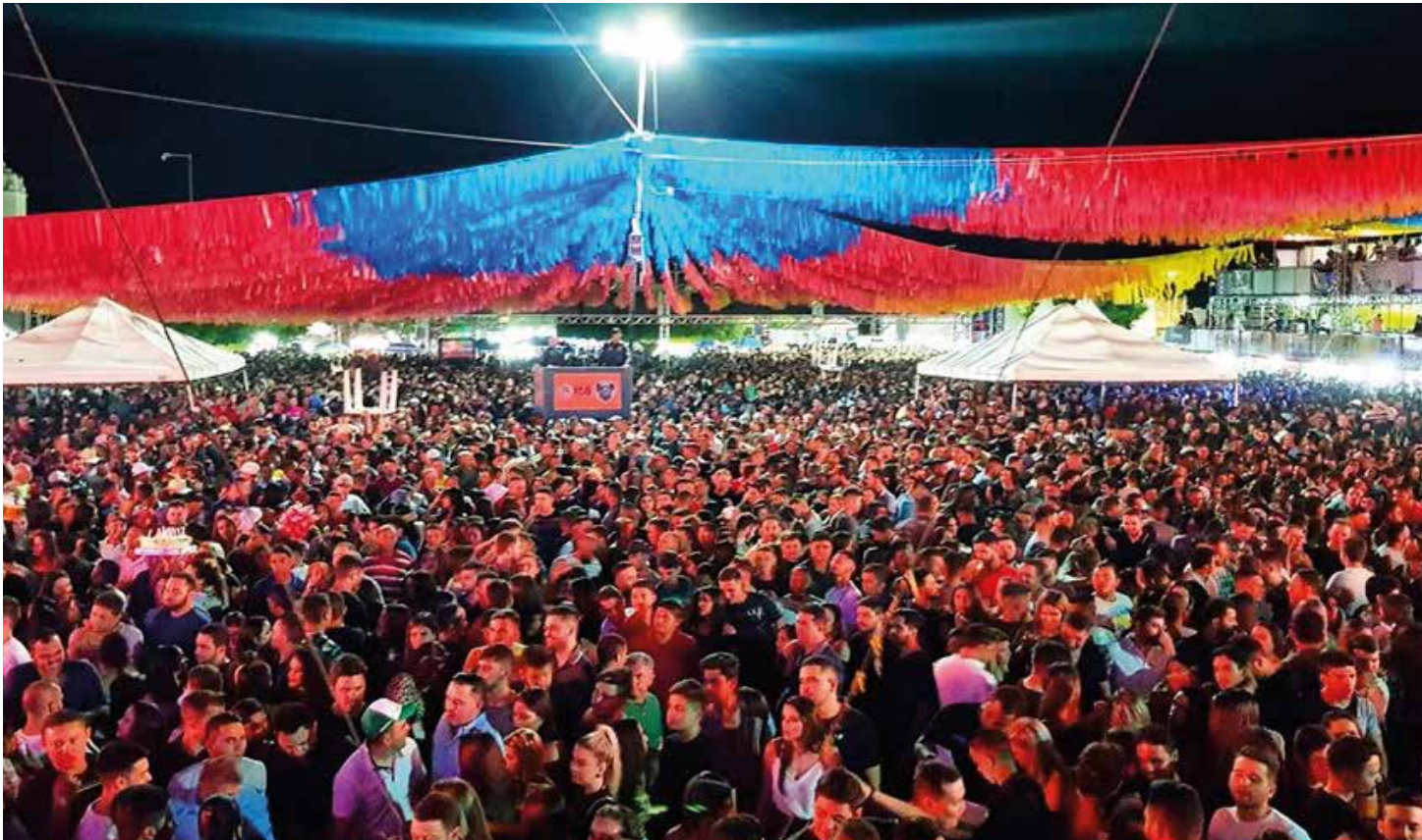
ICÓ PÁGINA 08