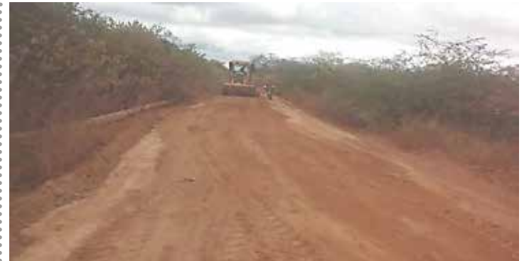
INDEPENDÊNCIA PÁGINA 07