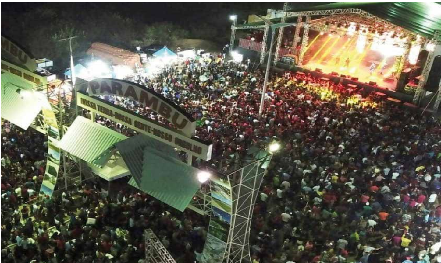
PARAMBU PÁGINA 05