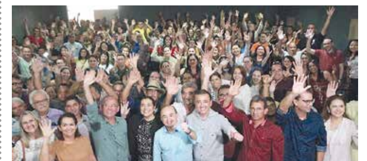
CAMOCIM PÁGINA 14