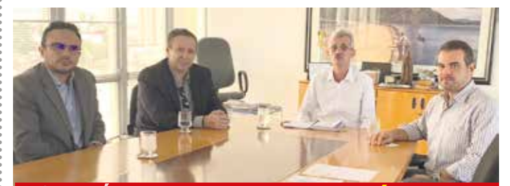
ORÓS PÁGINA 12