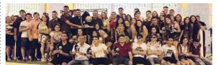
MOMBAÇA PÁGINA 13