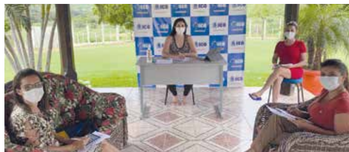
ICÓ PÁGINA 06