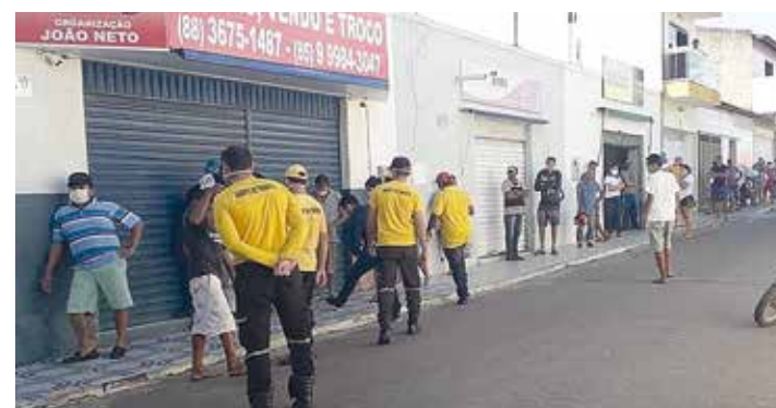
INDEPENDÊNCIA PÁGINA 02