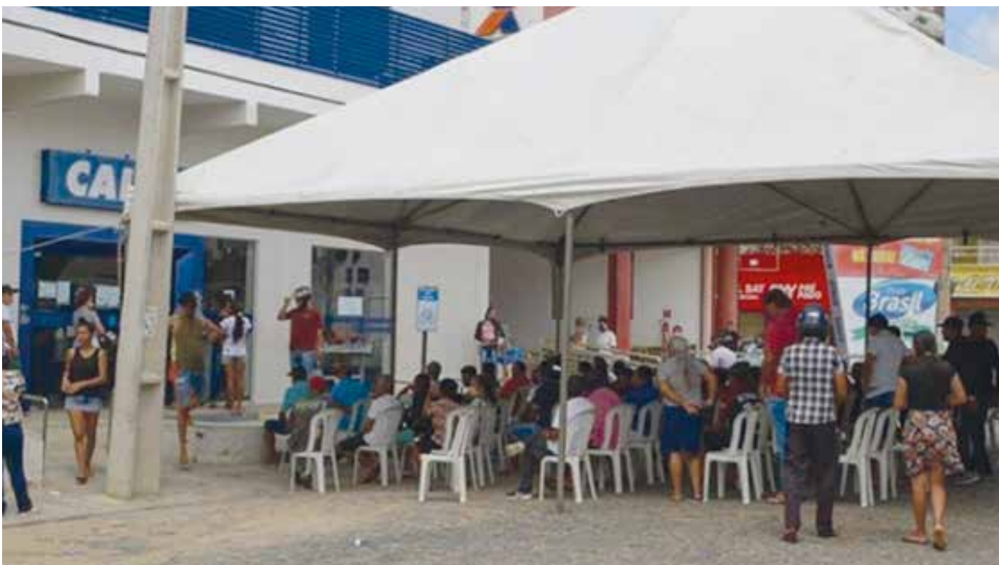
QUIXERAMOBIM PÁGINA 04