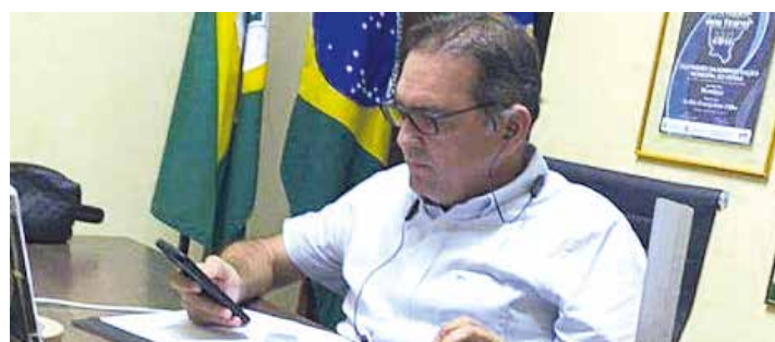
MOMBAÇA PÁGINA 05