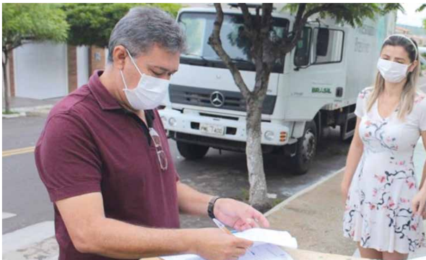
NOVO ORIENTE PÁGINA 03