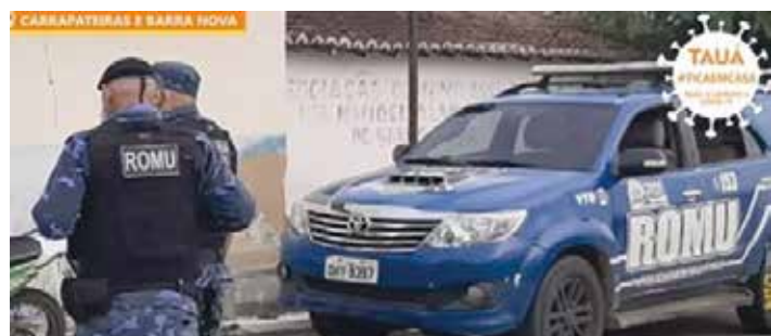
TAUÁ PÁGINA 08